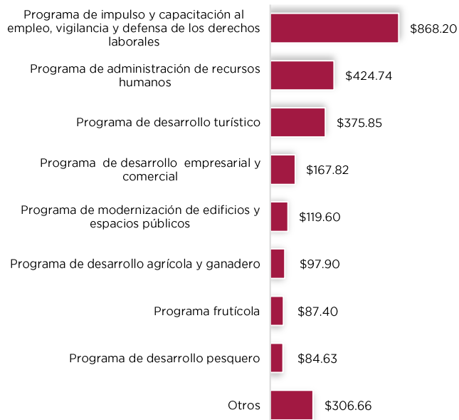
Programa presupuestario (millones de pesos)

Los programas presupuestarios permiten organizar en forma representativa y homogénea las asignaciones de recursos; además, mejora los diagnósticos, focaliza la población potencial y se conoce con mayor claridad el impacto de la intervención gubernamental en el bienestar de la población.